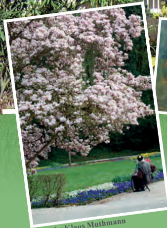
1. Preis: Klaus Muthmann