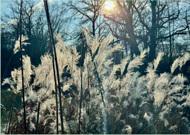
Der „neue“ Hainweiher, Bürgerparkverein