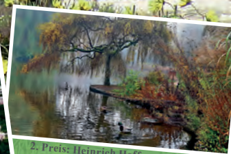
2. Preis: Heinrich Hoffmann