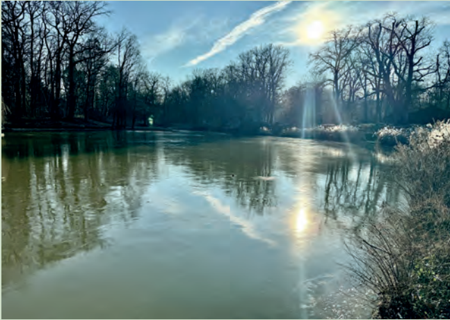
Der „neue“ Hainweiher, Bürgerparkverein