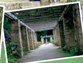
3. Preis: Jürgen Pape