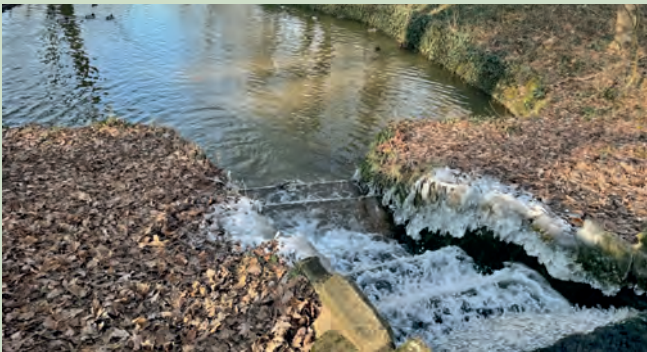
Der „neue“ Hainweiher, Bürgerparkverein