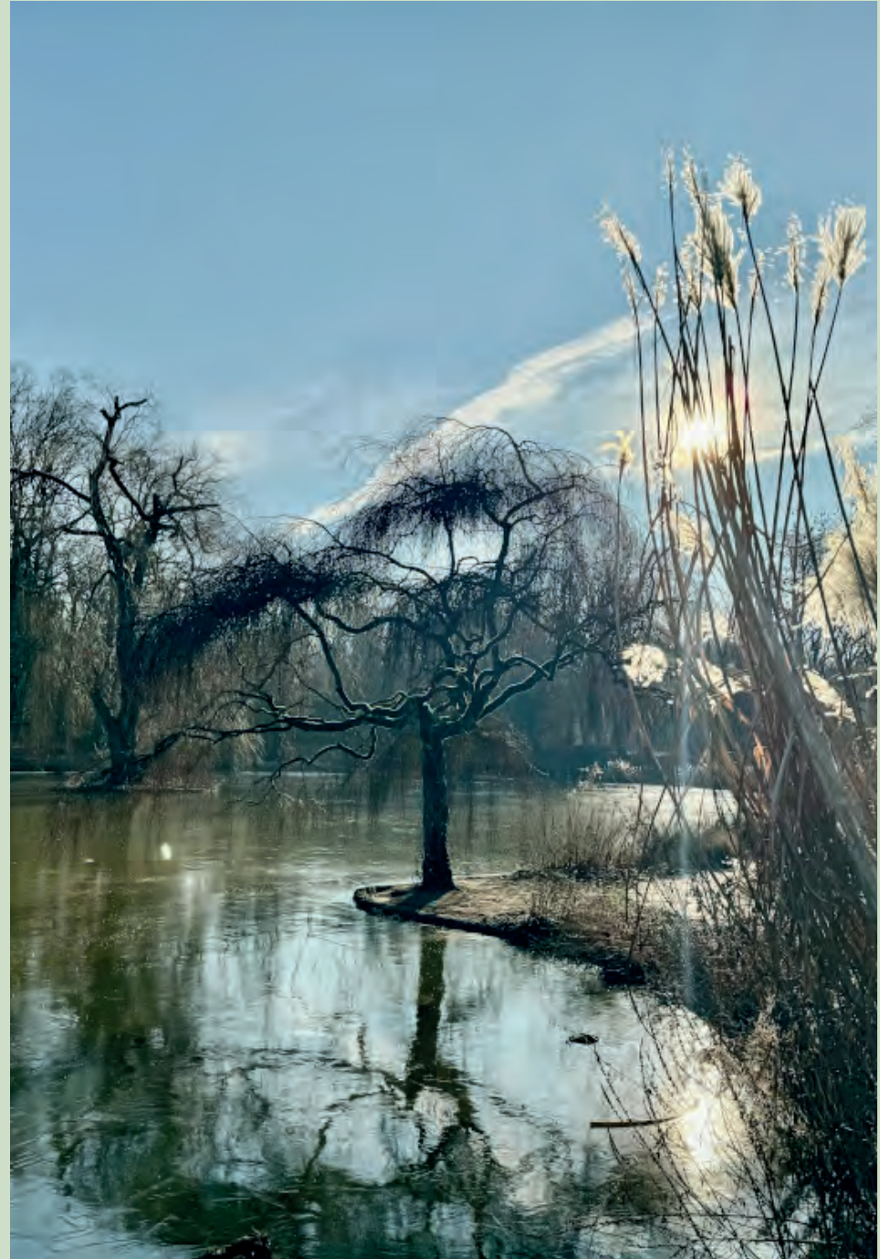
Der „neue“ Hainweiher, Bürgerparkverein