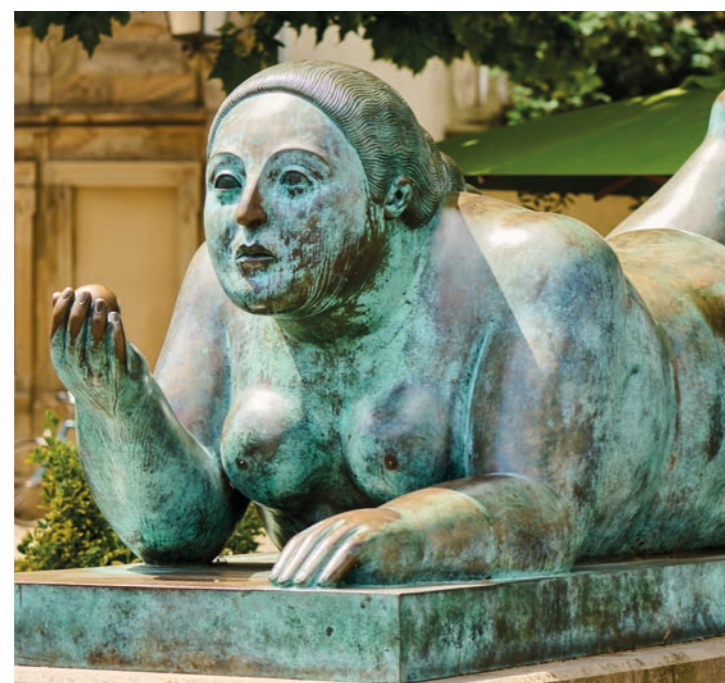
Botero | Liegende Frau mit Frucht