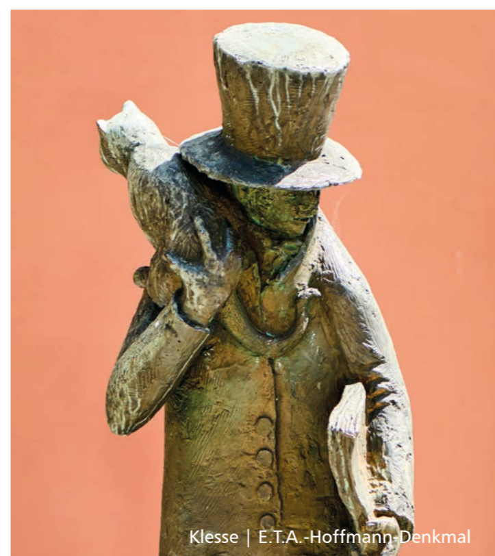
E.T.A.-Hoffmann-Denkmal