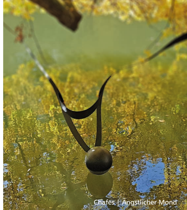
Chafes | Ängstlicher Mond