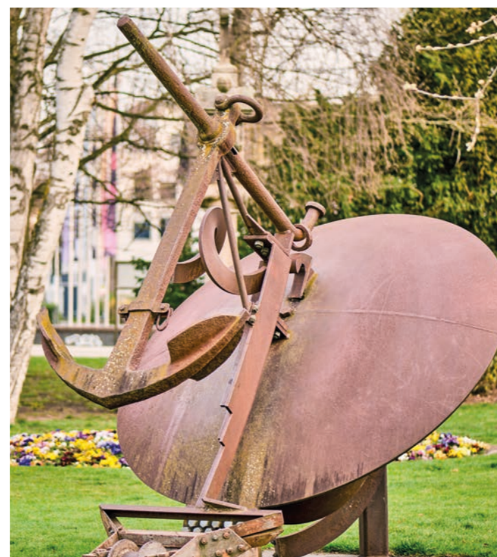
Luginbühl | Ankerfigur