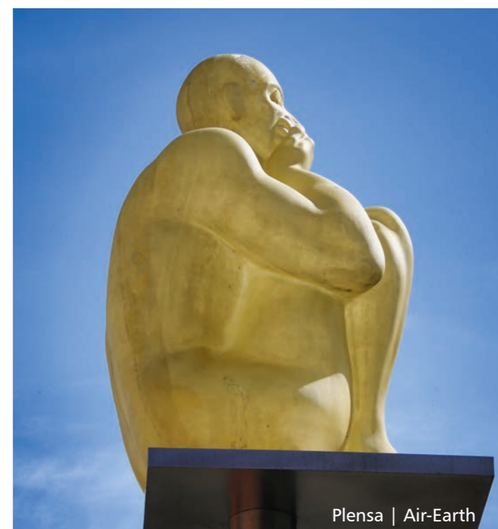
Plensa | Air-Earth