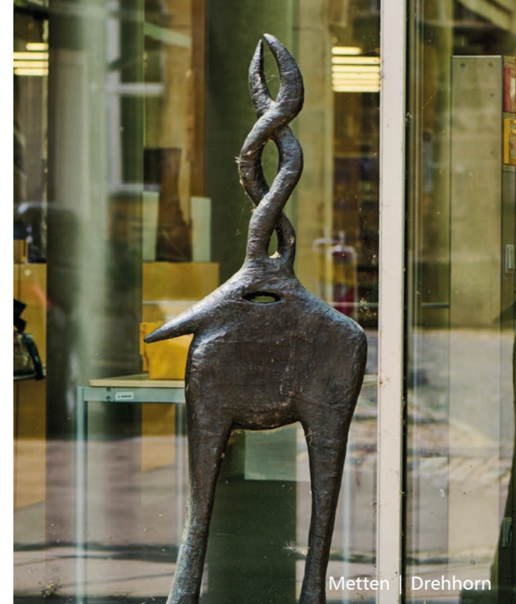
Metten | Drehhorn