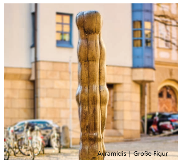
Avramidis | Große Figur