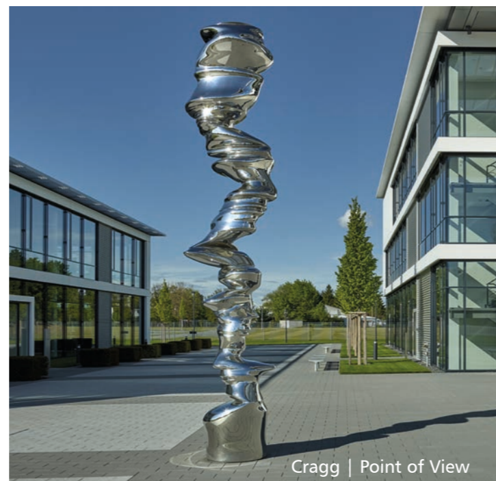
Cragg | Point of View